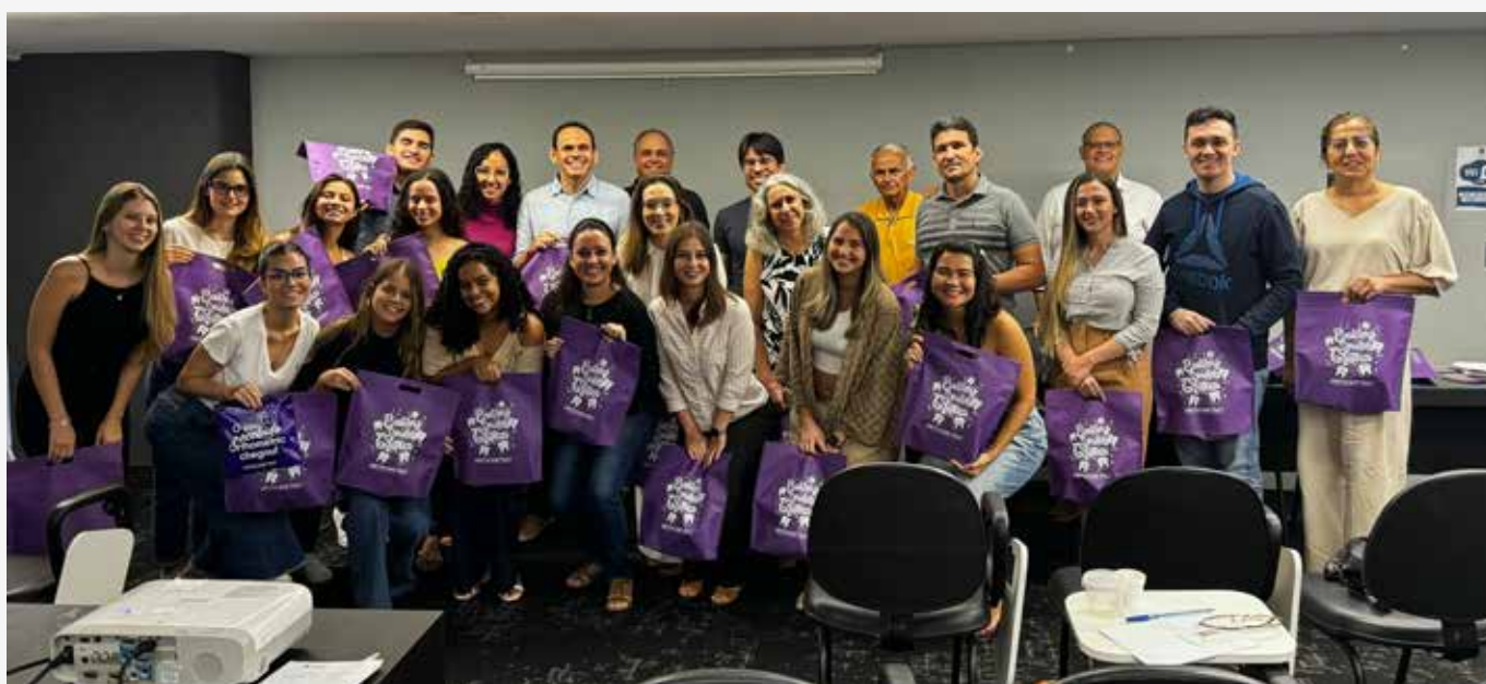
↑ Figura 2: Membros da ABOR RN no encontro para discussão e planejamento de casos clínicos. O evento também teve a participação dos alunos da Liga Acadêmica de Ortodontia da UFRN.