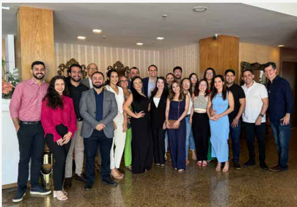
Figura 5: Participantes do 1º encontro da ABOR RN em Mossoró/RN.