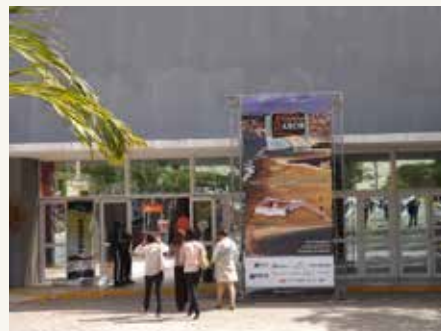
Entrada do evento - Centro de Convenções.