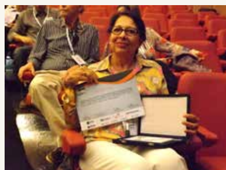
Representante do trabalho premiado em primeiro lugar no Fórum Científico