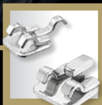
Lingual 2D® bracket autoligado lingual