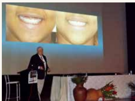
Curso Internacional Eustaquio Araújo