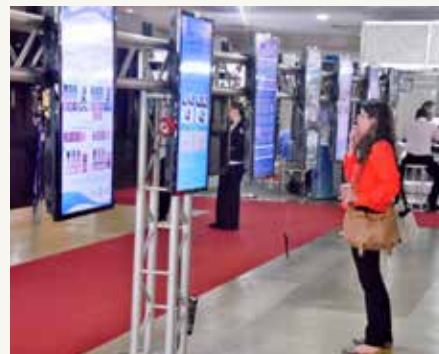
Apresentação de posteres.

Diversas atividades do Board Brasileiro de Ortodontia e Ortopedia (BBO) foram realizadas durante o 9º Congresso Internacional da ABOR. Dentre elas o Exame da Fase I do processo de Certificação – Diagnóstico e Planejamento, destinado a recém-formados e alunos concluintes do último ano de pós-graduação em Ortodontia, além do Curso de Orientação, dirigido aos candidatos à Fase II, do Exame do BBO.