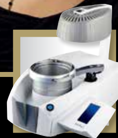
Track V® plastificadora digital à vácuo