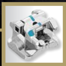
BioQuick® bracket autoligado metálico interativo