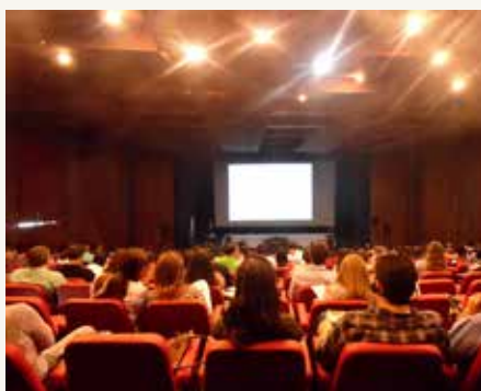
Congressistas participam de curso internacional.