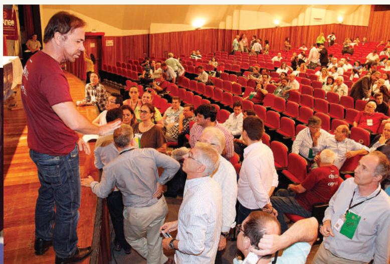
Os debates transcorreram por dois dias, culminando com a plenária.