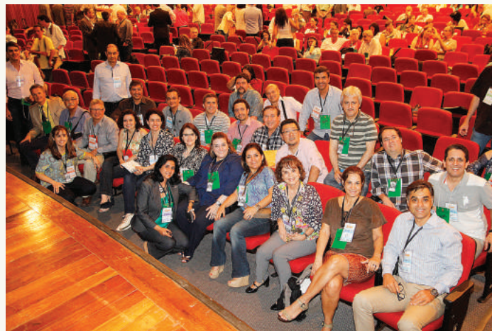
Membros da ABOR estiveram presentes em número significativo durante a ANEO.

Agradecemos a todas as associações estaduais, assim como aos Conselhos Regionais de Odontologia, professores e coordenadores de cursos de especialização em Ortodontia, alunos de especialização e de graduação que contribuíram ao longo desse processo.