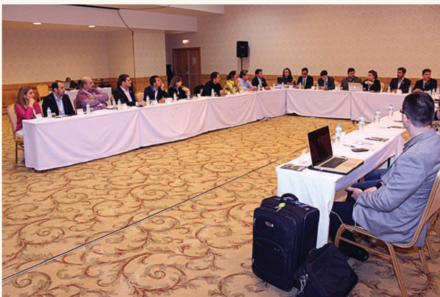
Conselho Superior da ABOR.

política à associação, haja vista que a ABOR não tem expressividade nesse meio, seja nos conselhos de educação, nas secretarias de saúde, nos sindicatos ou entre outros órgãos.