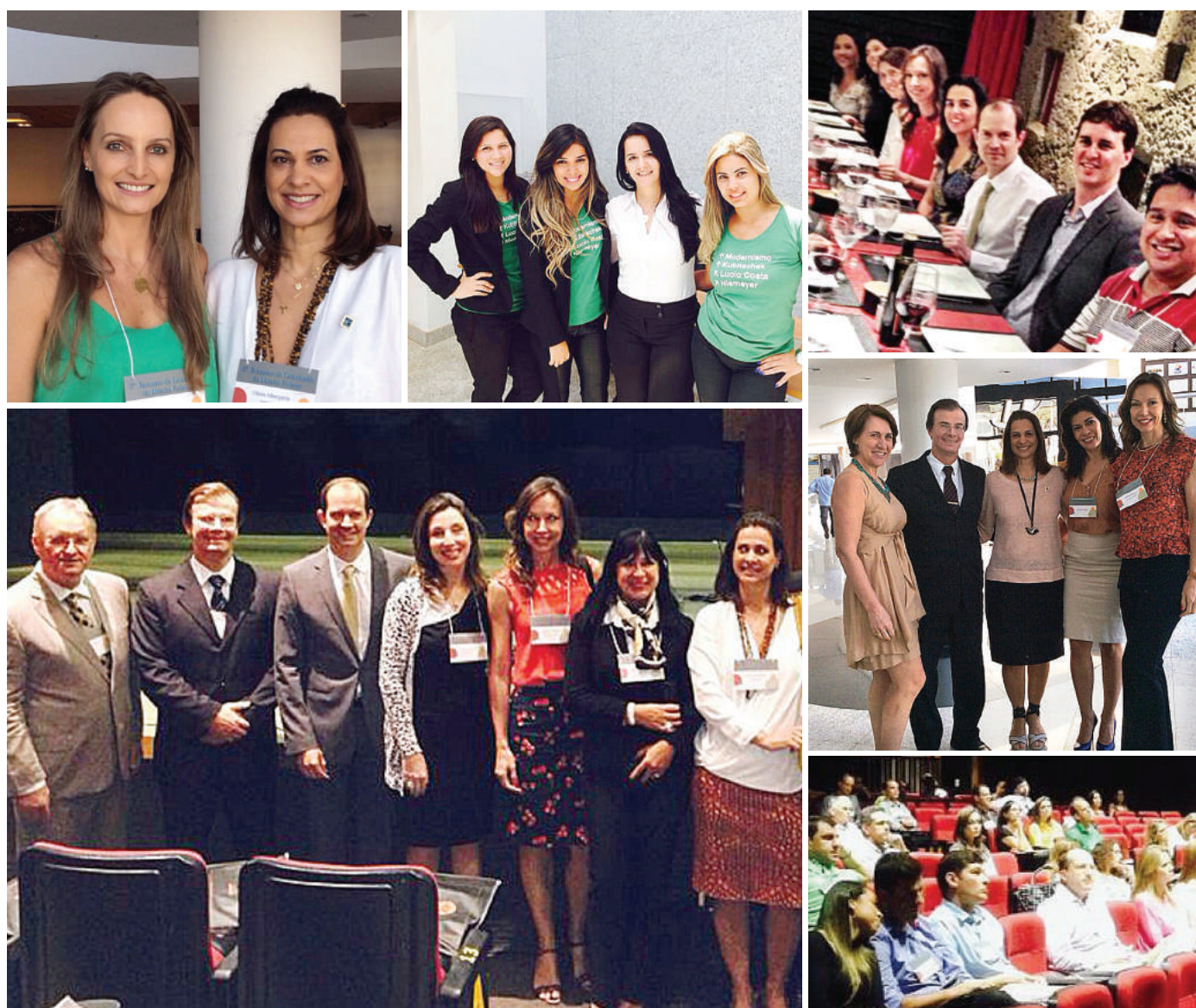
Momentos marcantes do 6º Encontro de Ortodontia do DF. O Encontro contou com a participação de 11 palestrantes.

A Diretoria da ABOR-DF gostaria de agradecer a todos os palestrantes e participantes, que contribuíram para o sucesso do evento!