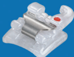
Sensation C (Autoligado)