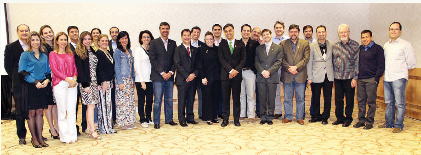
Conselho Superior da ABOR em reunião, durante o OrtoRio Premium.