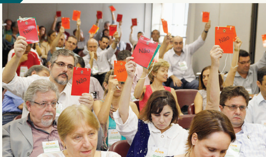
Os cirurgiões-dentistas votaram sobre temas importantes para as especialidades da Odontologia.