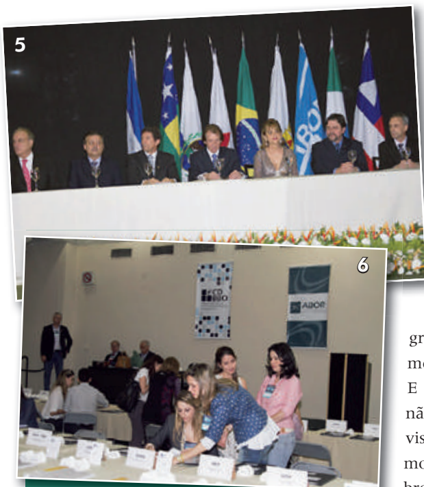
Figura 5 - Composição da mesa para entrega dos certificados de diplomação do BBO, turmas 2010 e 2011.