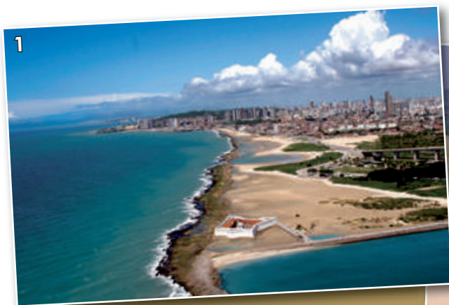
Figura 1 - Fortaleza dos Reis Magos, Natal - RN.