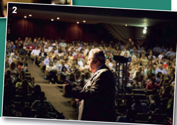
Figura 2 - Palestra do Prof. Eustáquio Araújo (EUA) durante o 8º Congresso da ABOR.