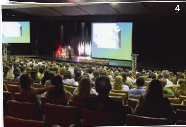
Figuras 3 e 4 - Palestra do Prof. James McNamara (EUA) durante o 8º Congresso da ABOR.