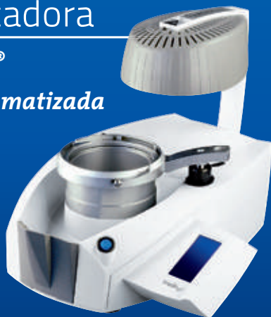
Track V® digital automatizada