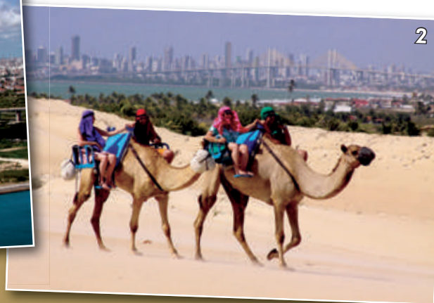
Figura 2 - Dromedários, Praia de Genipabu - RN.