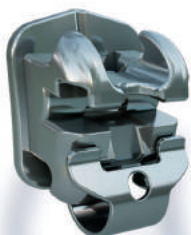
Braquete Metal Autoligado

Somos distribuidores da American Orthodontics, a maior fabricante do mundo de aparelhos ortodônticos, o que proporciona o mais alto nível de qualidade do produto, entrega confiável e serviço personalizado .