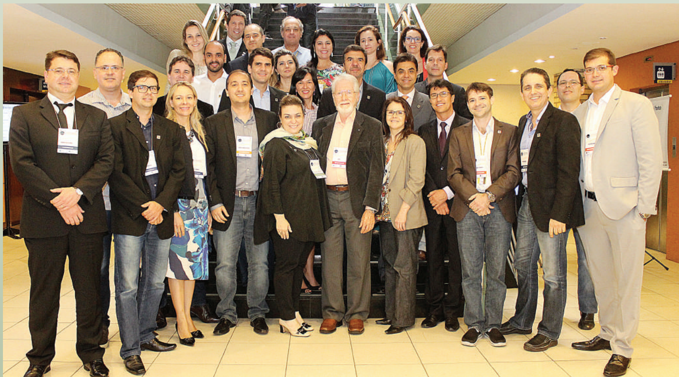
Conselho Superior Deliberativo e Diretoria Executiva da ABOR durante o 10º Congresso de Ortodontia da ABOR.