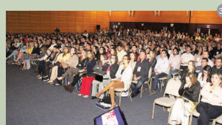
Figuras 22 a 30: Tour pelo 10º Congresso.