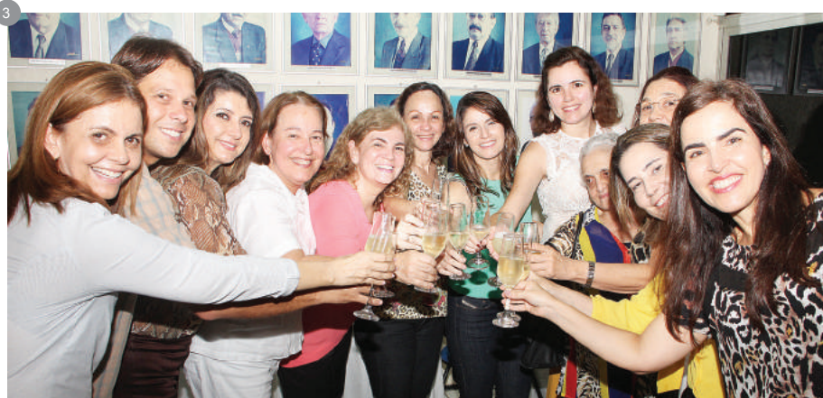
Figura 3: Brinde da Diretoria com votos de sucesso na gestão.