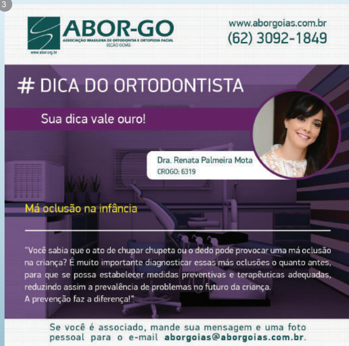
Figura 1: Post.