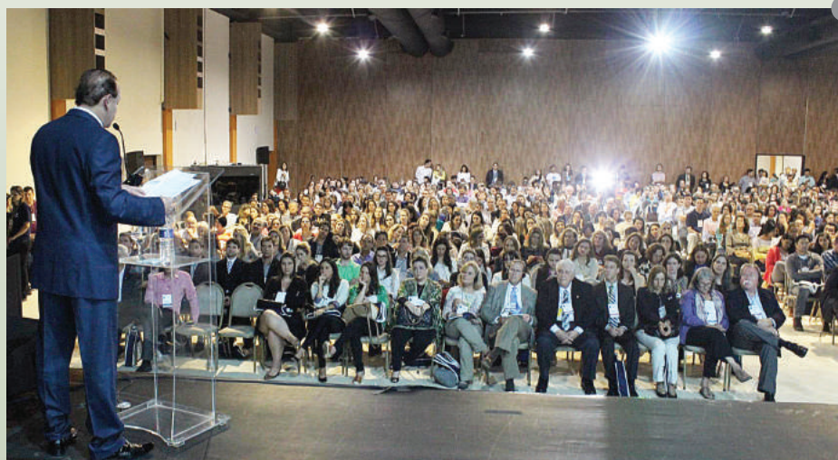
Figura 3 e 4: Em torno de 800 pessoas compareceram à cerimônia de abertura do 10º Congresso Internacional da ABOR. A plateia atenta se emocionou com o espetáculo proporcionado pelos bailarinos do Balé Bolshoi de Joinville, Santa Catarina.