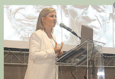
Os mais renomados palestrantes do cenário ortodôntico mundial brilharam em frente à plateias lotadas. Figura 5: Birte Melsen-Dinamarca. Figura 6: Lorenzo Franchi-Itália. Figura 7: Maria Laura Irurzun-Argentina.