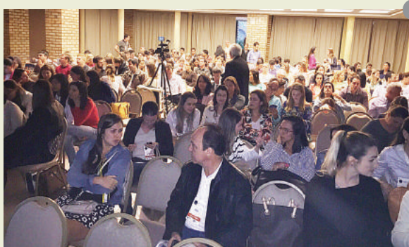
Figuras 1, 2 e 3: A Diretoria da ABOR-MG prestigia conferências e cerimônia de certificação do BBO de ilustres associados mineiros, todas com grande número de participantes.