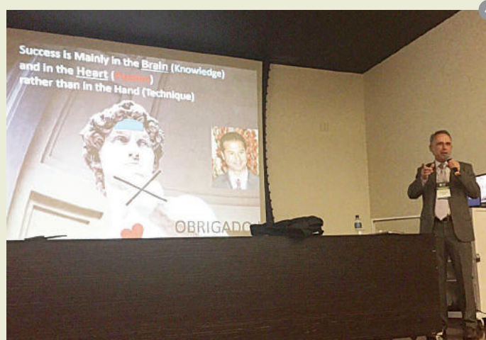
Figuras 1-4: Palestrantes e participantes da XVII Jornada de Ortodontia de Minas Gerais puderam trocar experiências e conteúdo de alta qualidade durante o evento.