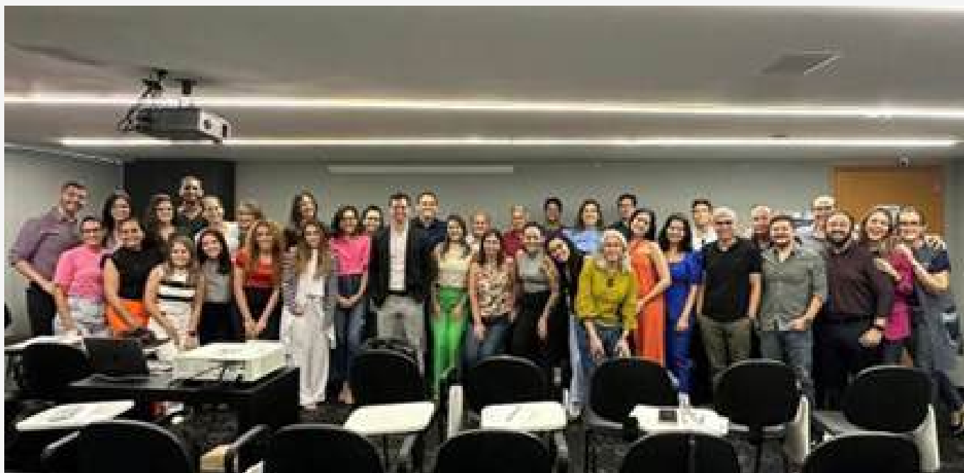
↑ Figura 6: Membros da ABOR RN no curso do Prof. Dr. Marcel Farret que encerrou as atividades científicas da ABOR RN no ano de 2023.

Portanto, com o sucesso e boas energias de 2023, finalizamos o ano com sentimento de gratidão, dever cumprido e muitas metas para 2024. Aproveito o momento para desejar boas festas e um ano vindouro de muito trabalho e realizações para ABOR Nacional e estaduais.