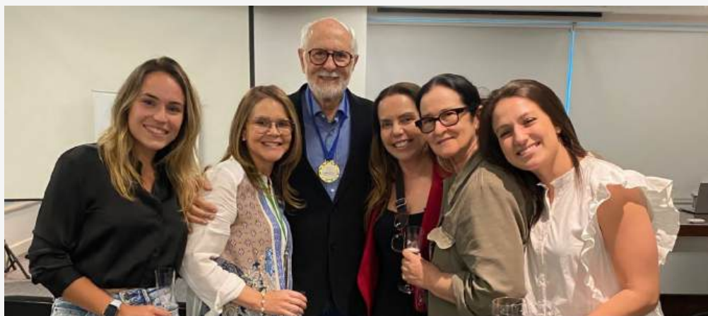
↑ Figura 4 e 5: Coquetel