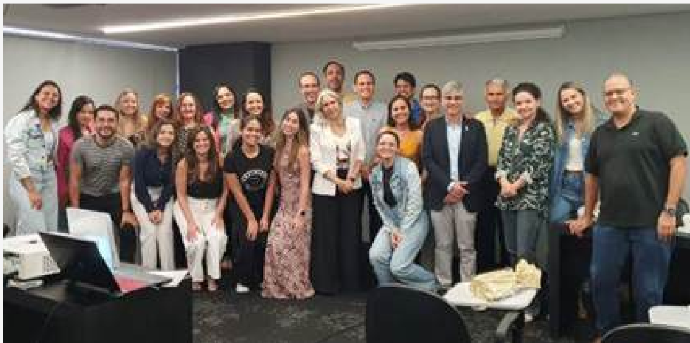
↑ Figura 1: Participantes do curso “Meus casos clínicos do Board sem paradigmas”. O evento também contou com a participação de alunos da Graduação da Universidade Potiguar.

pudessem desmistificar o exame, assim como, incentivar os associados a prestarem a prova do BBO. O evento contou a participação de mais de 20 colegas. Inclusive foi especial para mim, visto que me submeteria a fase I e II do exame na cidade de Ribeirão Preto entre os dias 29 de junho e 01 de julho.